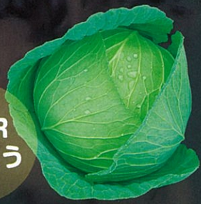
揃いの良い高品質キャベツ