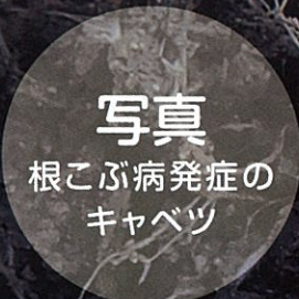
写真 根こぶ病発症の キャベツ

「ノウリンの根こぶ病抵抗性キャベツ」なら 根こぶ病汚染圃場でも安定生産が可能です。