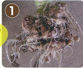
1 こぶ状になった根