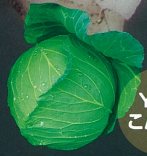
玉伸びしやすく、作りやすい